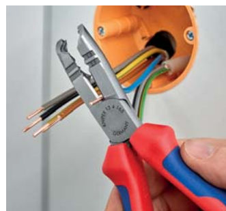
Schneiden beim Einkürzen von Einzelleitern