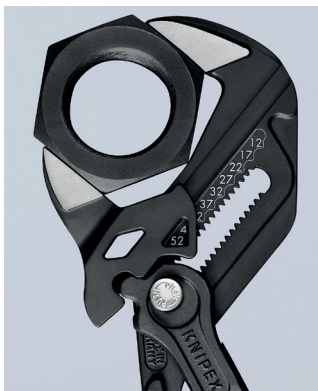
Schlüsselweite metrisch (Vorderseite) und zöllig (Rückseite) am Zangenkopf eingelastet