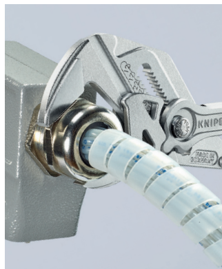
Beschädigungsfreies Arbeiten auf empfindlichen Oberflächen; als VDE-Variante auch an elektrischen Anlagen