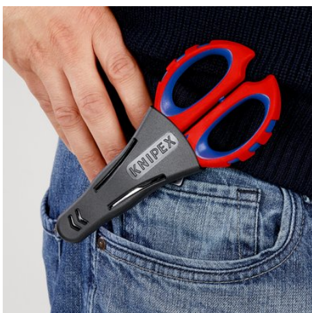
Sicher verstaut und immer griffbereit

Technische Änderungen und Irrtümer vorbehalten