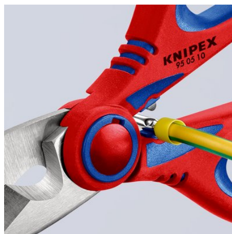
95 05 10 SB: Schnelles, einfaches Crimpen