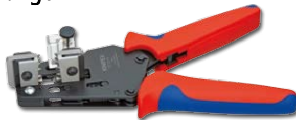
12 12 11