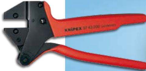
97 43 200 EAN: 4003773030812