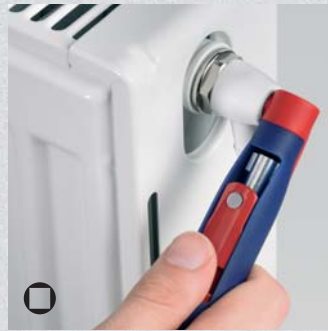
Vierkant zur Heizungsentlüftung (Bestell-Nr. 00 11 07 + 00 11 08)