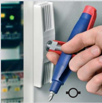
Öffnen eines Schaltschrankes mit Doppelbart (Bestell-Nr. 00 11 07)