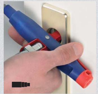
Stufenvierkant zum Öffnen einer Tür ohne Beschlag (Bestell-Nr. 00 11 08)