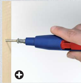
Anziehen einer Schraube mit Kreuzschlitz-Bit PH2 (Bestell-Nr. 00 11 07 + 00 11 08)